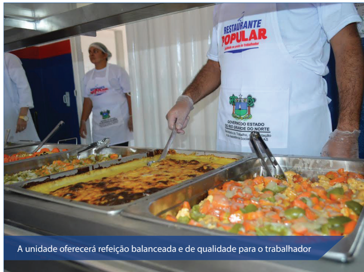
A unidade oferecerá refeição balanceada e de qualidade para o trabalhador

Semanalmente são servidas mais de 110 mil refeições nas 31 unidades