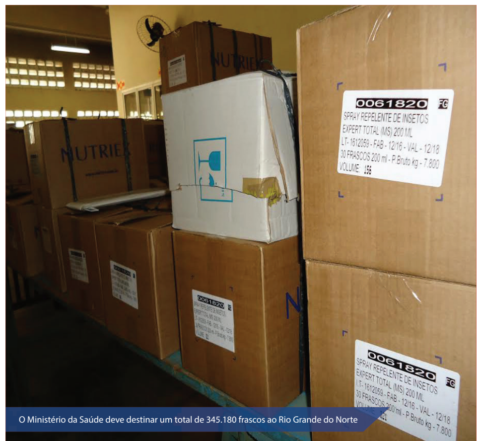
O Ministério da Saúde deve destinar um total de 345.180 frascos ao Rio Grande do Norte

Além disso, também é necessário estabelecer uma rotina para eliminar recipientes que possam acumular água parada. Quinze minutos de vistoria são suficientes para manter o ambiente limpo. Pratinhos com vasos de planta, lixeiras, baldes, ralos, calhas, garrafas, pneus e até brinquedos podem ser os vilões e servir de criadouros para as larvas do mosquito.