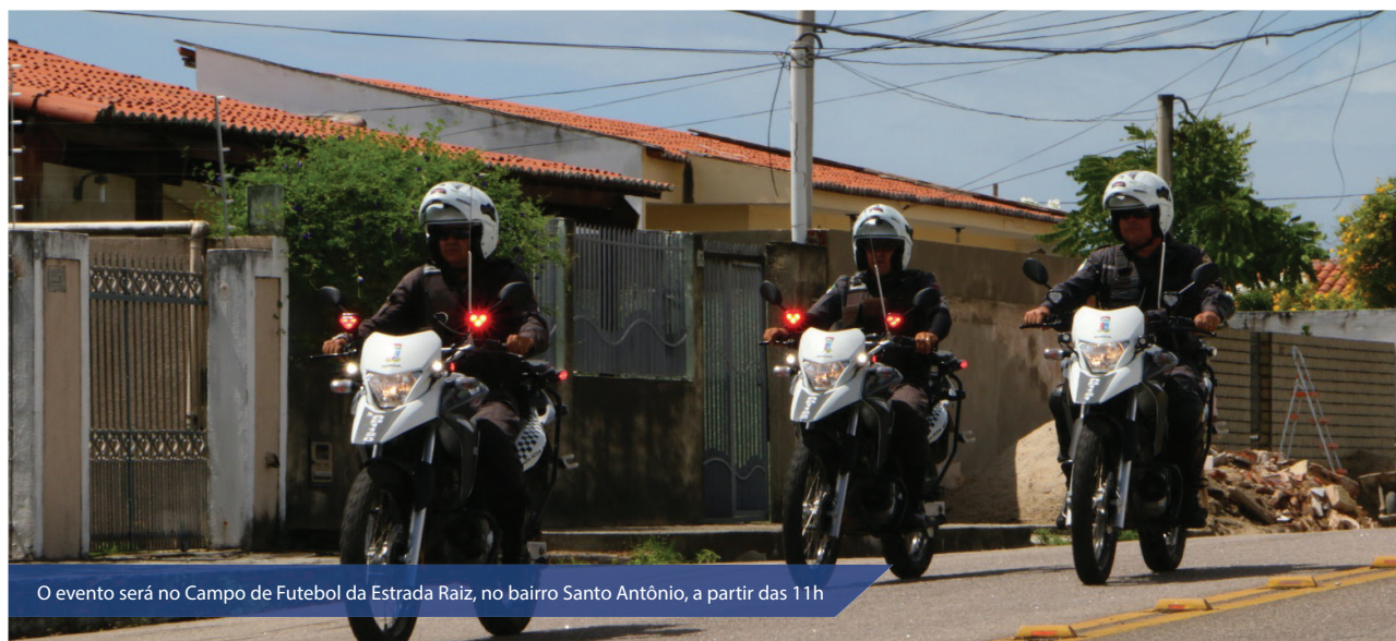
O evento será no Campo de Futebol da Estrada Raiz, no bairro Santo Antônio, a partir das 11h

O Governo do Estado, por meio da Secretaria de Estado da Segurança Pública e da Defesa Social (Sesed), lança neste sábado (18) o programa Ronda Cidadã na cidade de Mossoró. O evento será no Campo de Futebol da Estrada Raiz, no bairro Santo Antônio, a partir das 11h.