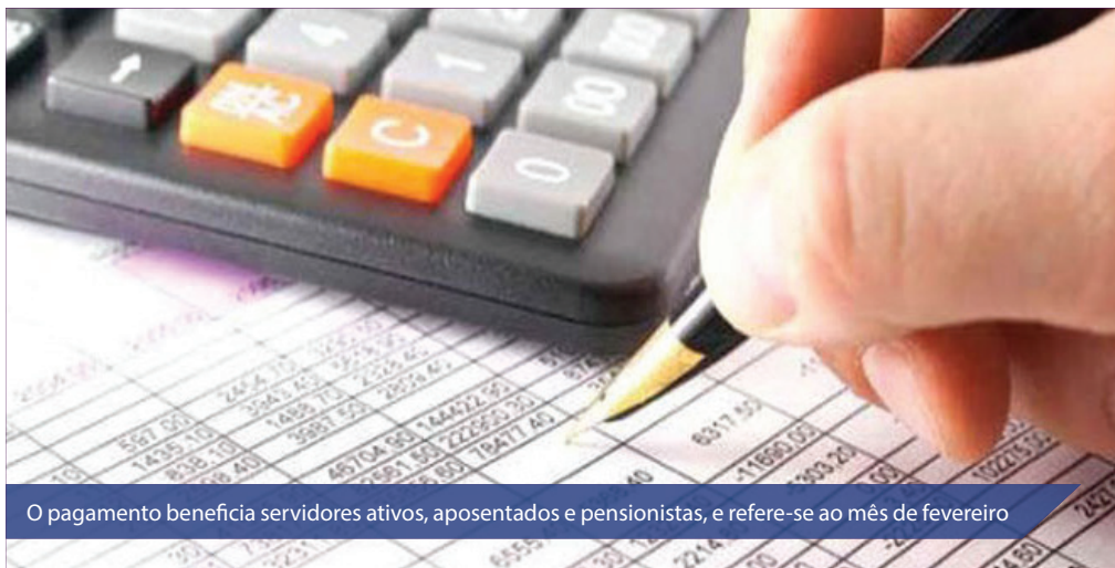
O pagamento beneficia servidores ativos, aposentados e pensionistas, e refere-se ao mês de fevereiro

O Governo do RN deposita hoje (17) uma parcela de R$ 4 mil a todos os servidores que possuem vencimentos acima desse valor. O pagamento beneficia servidores ativos, aposentados e pensionistas, e refere-se ao mês de fevereiro. A data para pagamento do restante do valor será anunciado mediante disponibilidade de recursos.